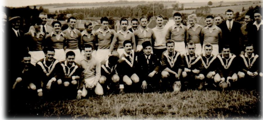
1952 – Match de gala de la Ducasse au Stade de la Cavée US St Pol – BCP Arras

Hélas, je n'étais plus dans l'équipe puisque j'étais "sous les drapeaux" à ANGERS.