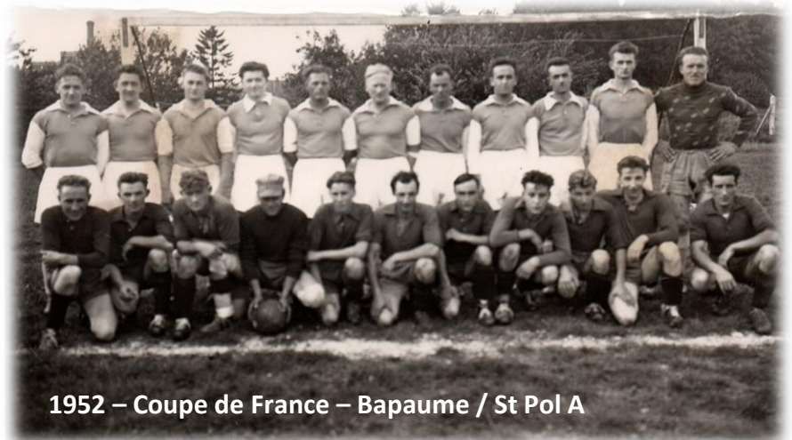
1952 – Coupe de France – Bapaume / St Pol A